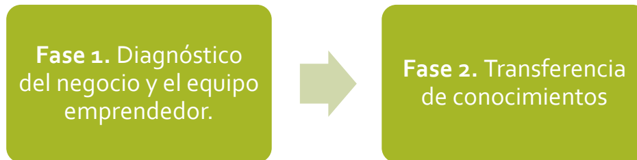
Gráfico 1. Fases de la ESTACIÓN 2 TRANSFORMATE

La primera corresponde al "DIAGNÓSTICO DEL NEGOCIO" y la segunda fase a la "TRANSFERENCIA DE CONOCIMIENTO" , cada una de ellas corresponde a un paso obligatorio de los emprendedores seleccionados en el marco del programa.